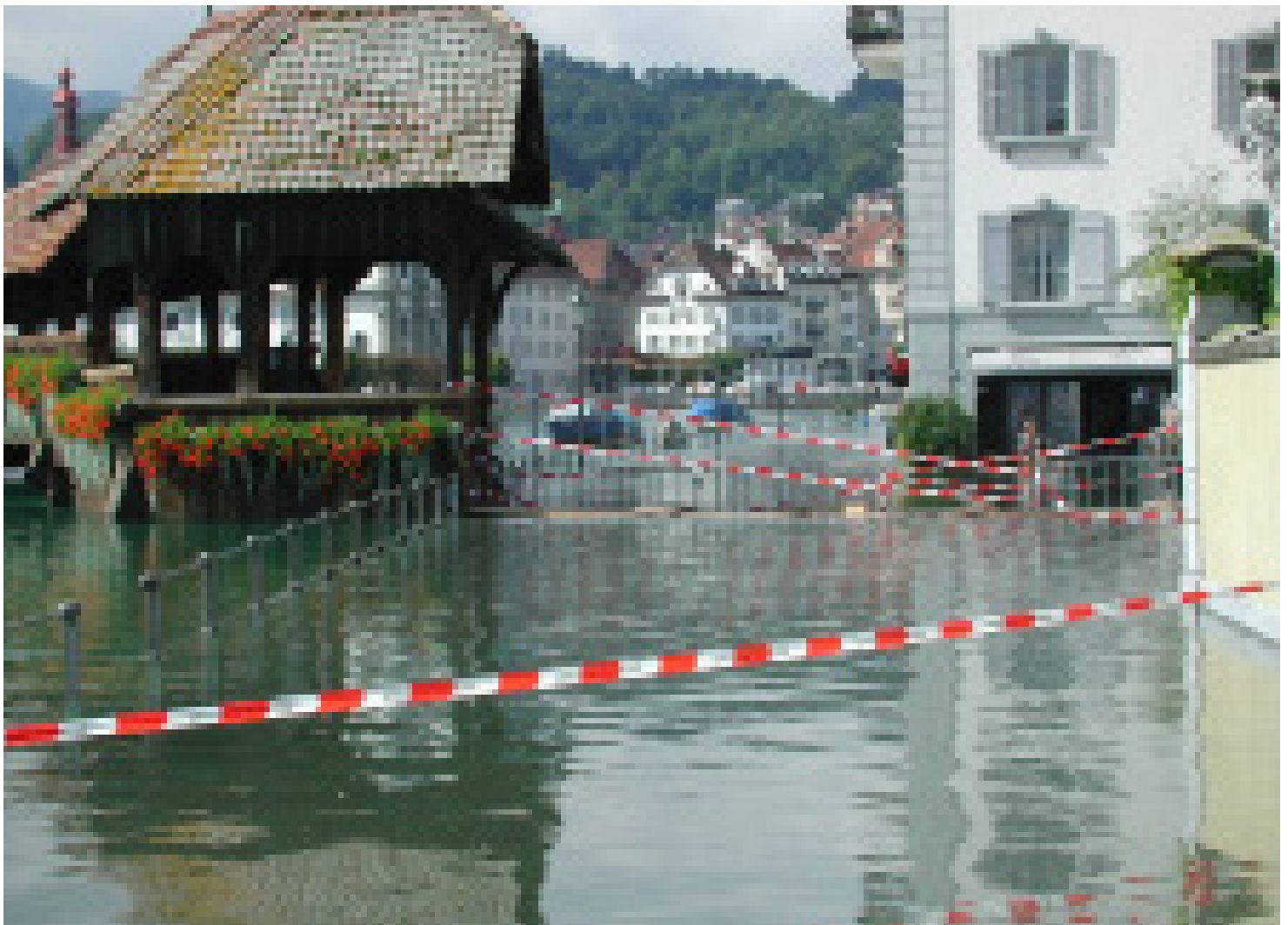
Hochwasser in Luzern 2005

Die Betriebsunterbrechung wird zudem als eines der wichtigsten globalen Geschäftsrisiken betrachtet. Sie lähmt das Geschäft und hat direkte Auswirkungen auf die Erfolgsrechnung.