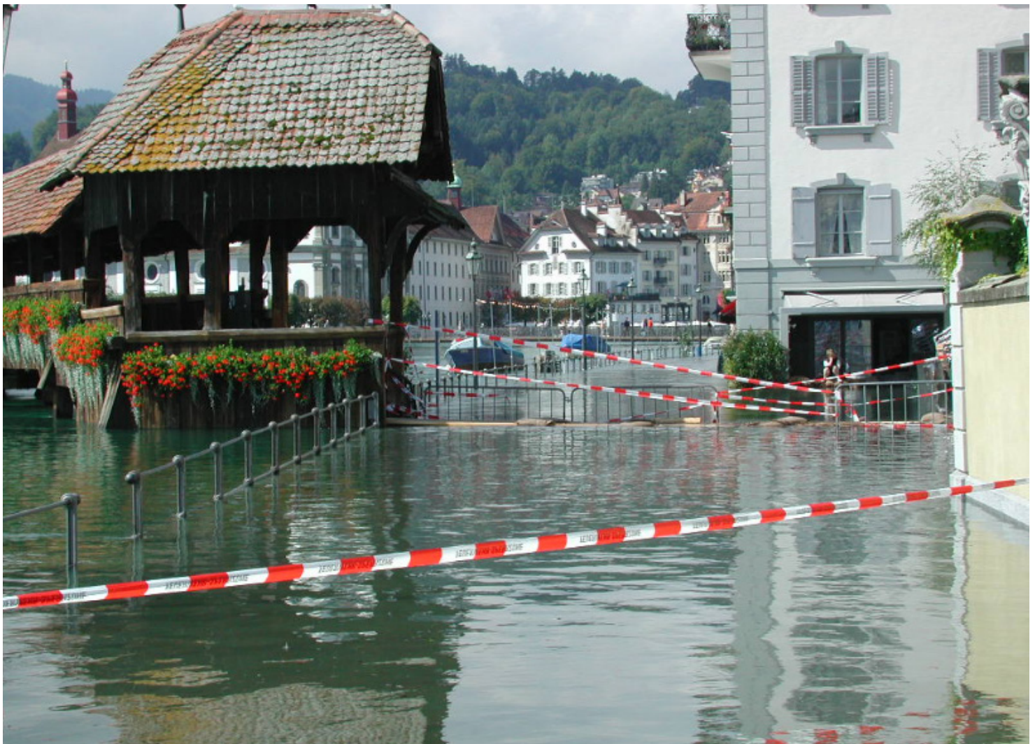
Hochwasser in Luzern 2005

Die Betriebsunterbrechung wird zudem als eines der wichtigsten globalen Geschäftsrisiken betrachtet. Sie lähmt das Geschäft und hat direkte Auswirkungen auf die Erfolgsrechnung.